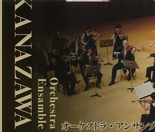
KANAZAWA Orchestra Ensemble オーケストラ・アンサンブル金沢