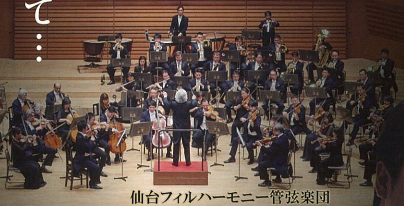
仙台フィルハーモニー管弦楽団