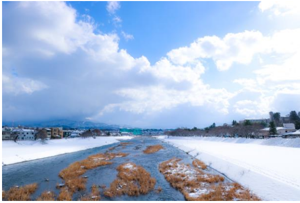
雪に染まる犀川緑地

昨夜の降雪からは考えられないくらい気持ちの良い青空。2日前より少し積雪は増えたかな。辿り着くまでの道は融雪のない場所は凍ってしまいツルツルガタガタ。それも北陸の冬らしさかな。ここから眺めると山側は雪が降っている様子。お日様が出ていて気持ち良かった。川沿いに足跡が残るのも冬らしいね。