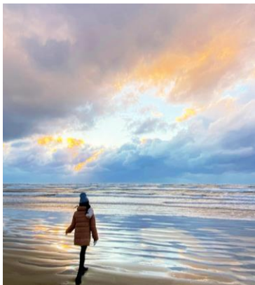
夕日に染まる大晦日の千里浜の海辺 綺麗な夕焼けでした