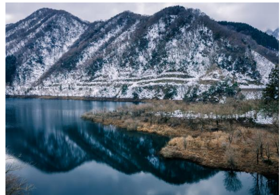
加賀のダム湖に臨む雪景色