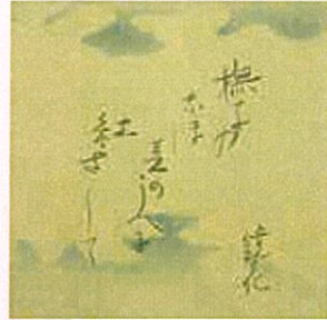
泉鏡花自筆色紙 「撫子のなほ其のうへに紅さして」(部分)