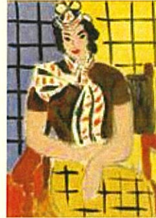
アンリ・マティス《襦袢の女》 1936年 ポーラ美術館蔵