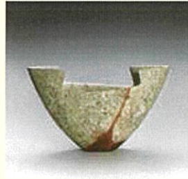
隠崎隆一《備前広口花器》 2012年 東京国立近代美術館蔵

日本工芸会陶芸部会の活動が2022年に50周年を迎えたのを記念して、伝統陶芸の活動の歩みと多彩な展開を紹介する展覧会です。歴代の間国宝の名品をはじめ、草創期に勢力を二分した日展や伝統の世界に刺激を与え続けている陶芸部会以外の陶芸家の作品、新進作家らの最新作まで、137名の139点で紹介します。