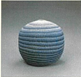
松井康成《練上硝裂文大壺》 1979年 茨城県陶芸美術館蔵