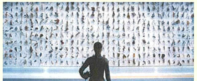
ムン・キョンウォン&チョン・ジュンホ《世界の終わり》2012 金沢21世紀美術館蔵 ©MOON Kyungwon and JEON Joanho

2つの新作映像インスタレーションをはじめとして、アポカリプス前後の異なる時間軸とその接続を精緻に描き出した代表作《世界の終わり》や金石地区(金沢市)での滞在制作の成果など、彼女たちの活動を多面的に紹介します。