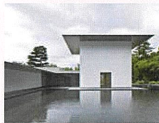
思索空間と水鏡の庭