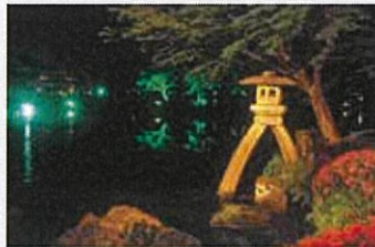
※金沢城公園は毎日ライトアップしています。

春の段:4月28日(木)~5月8日(日)(予定) 初夏の段:6月3日(金)~5日(日)(予定) 日程等詳細は県観光HP「ほっと石川旅ねっと」でご確認ください。 石川の四季観光キャンペーン実行委員会 (県観光企画課内) ☎076-225-1542