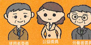
使用者委員 公益委員 労働者委員