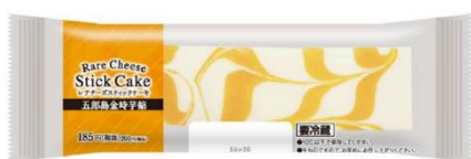
<10月6日（火）発売> レアチーズスティックケーキ （五郎島金時芋餡） （税込200円）

（※）愛知県、静岡県、岐阜県、三重県（一部店舗を除く）、富山県、石川県、福井県（一部店舗を除く）