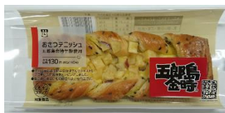
<10月6日（火）発売> おさつデニッシュ （五郎島金時芋餡使用） （税込140円）