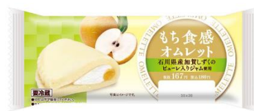
<10月13日（火）発売> もち食感オムレット （石川県産加賀しずくピューレ入りジャム使用） （税込180円）

今回発売する商品には、繊維が少なくホクホクした食感と強い甘みのある「五郎島金時」とジューシーで酸味を抑えた上品な甘さとなめらかな口あたりが特長の「加賀しずく」を使用しています。