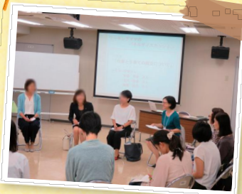
セミナーの様子は ホームページからご覧頂けます

毎回のセミナーが楽しく、 あっという間でした。 仕事と育児を生き生きと 両立する自分を想像して 復帰が楽しみになりました。