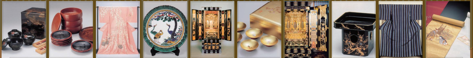
輪島塗 山中漆器 加賀友禪 九谷焼 金沢仏壇 金沢箔 七尾仏壇 金沢漆器 牛首袖 加賀紬