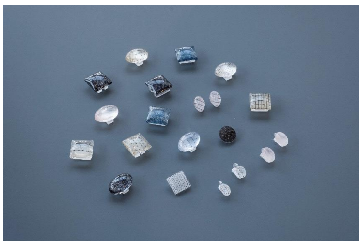
能登上布織元 (株)山崎麻織物工房