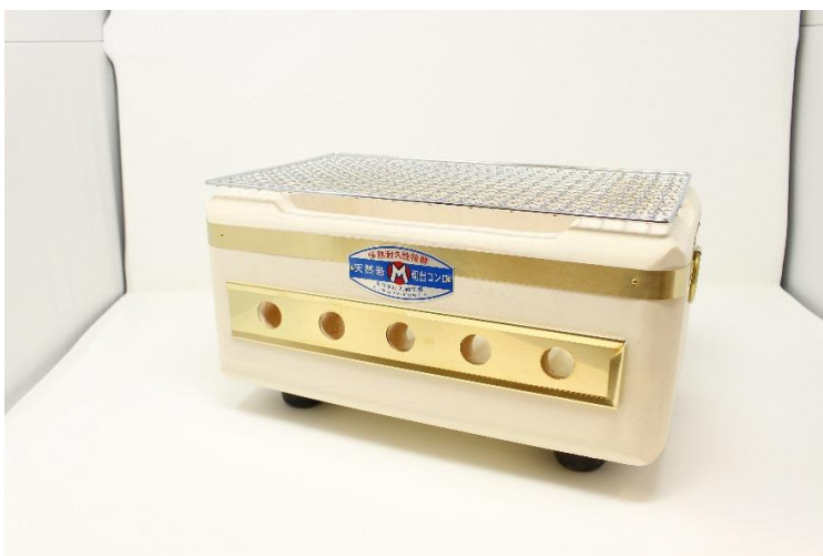
(有)丸和工業（切り出し七輪）