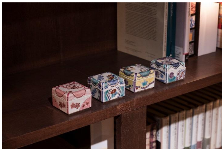
九谷焼窯元 結 (有)ミランテイジャパン