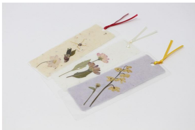
紙工房みわ会（久田和紙）