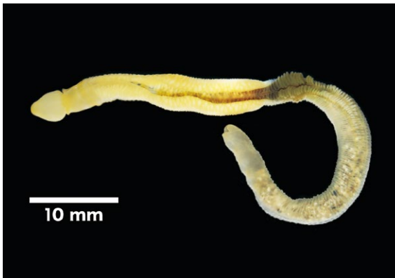
図3 シモダギボシムシ

スゲガサチヨウチン この種は2014年10月に日本海側では初めて見つかりました。九十九湾の潮通しのよい転石下で見つかっています。いまのところ九十九湾だけしか見つかっていないので、地域個体群に選定されました。