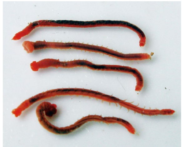
図9 エゾオフェリア

のと海洋ふれあいセンターでは、このような浅い海に暮らす生きものについての調査を続けています。しかし、まだまだ生息域についても把握しきれていないと痛感します。