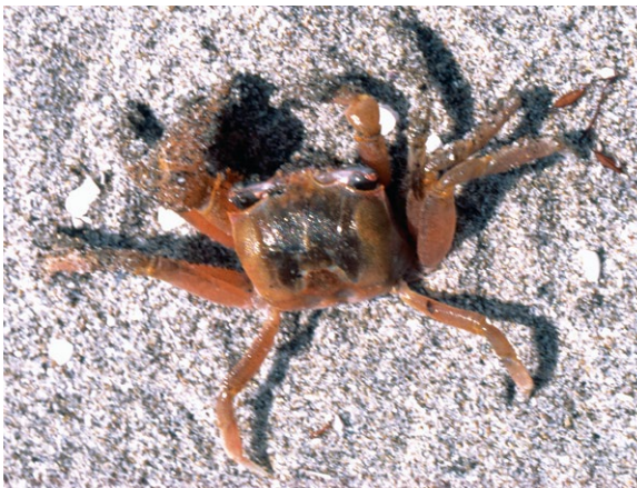
図7 スナガニ

スナガニ 主な生息地の砂浜海岸が、河川改修工事や護岸工事などにより、後退 こうたい し続けています。また、このスナガニも前述 ぜんじゆつ のアカテガニやクロベンケイガニも、幼生 ようせい の時に海で生活しないと幼ガニになれません。つまり、海と陸が両方連続した場所が必要なのです。この生息適地の減少も、これらカニ類3種が選定された理由になります。