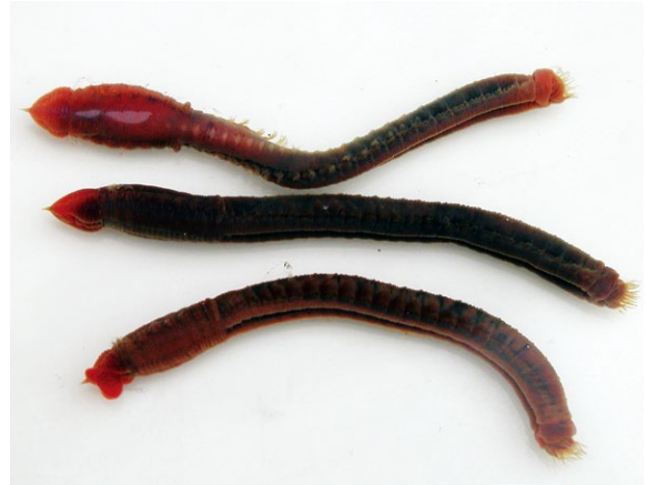
図8 サクラオフェリア

石川県では、サクラオフェリアは白山市と金沢市、エゾオフェリアはかほく市から志賀町にかけて見つかっています。砂浜海岸は近年海岸浸食の進行に伴って、砂浜の後退が続いています。このため、生息環境の悪化が予想されることから、地域個体群から準絶滅危惧にランク変更となりました。