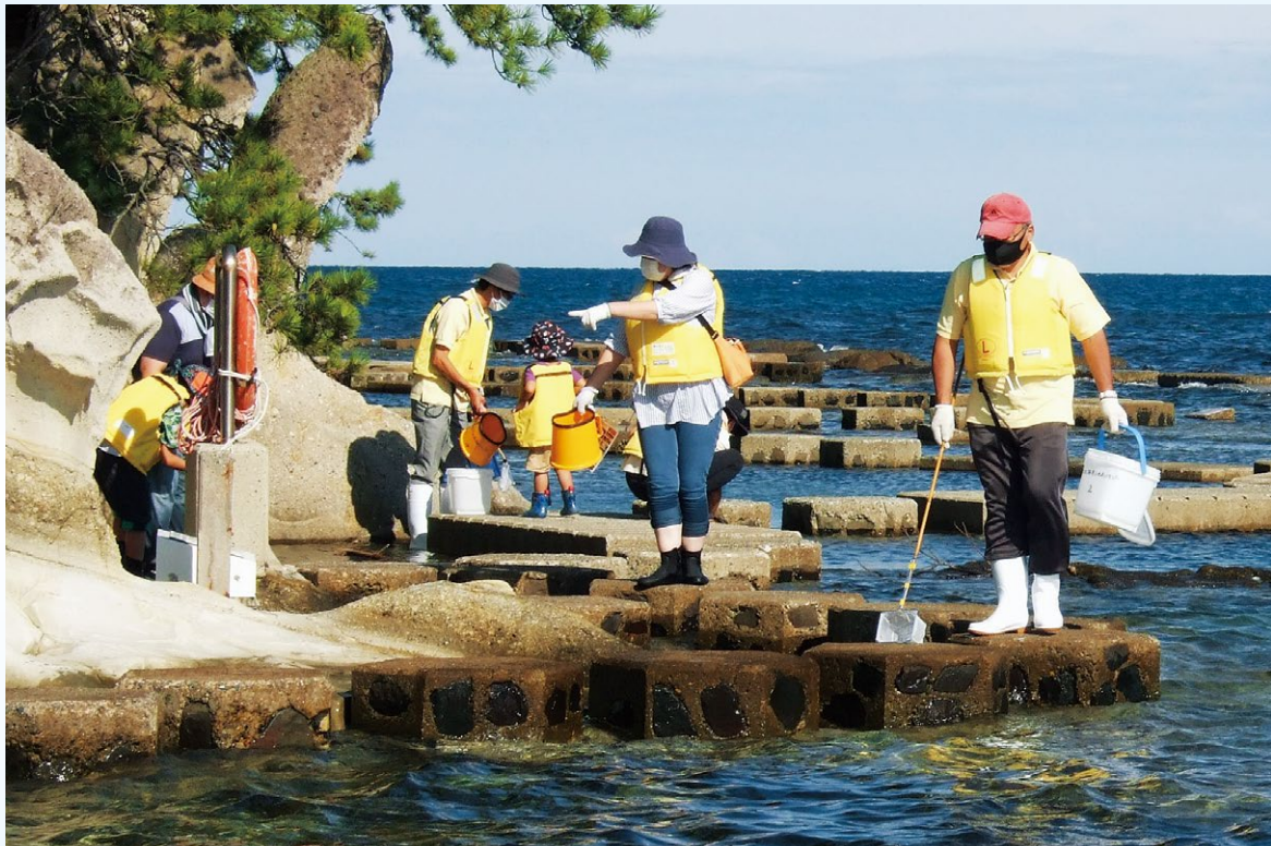
『海辺のウォークガイド』実施風景 (p. 6 参照)

NEWS LETTER OF NOTO MARINE CENTER No. 53, Dec. 2020