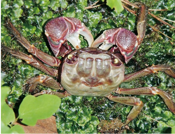
図6 クロベンケイガニ

は主に夜に活動しますが、クロベンケイガニはアカテガニよりも日中に活動するので、比較 ひかくてき 的 きかい に見つける機会が多いようです。