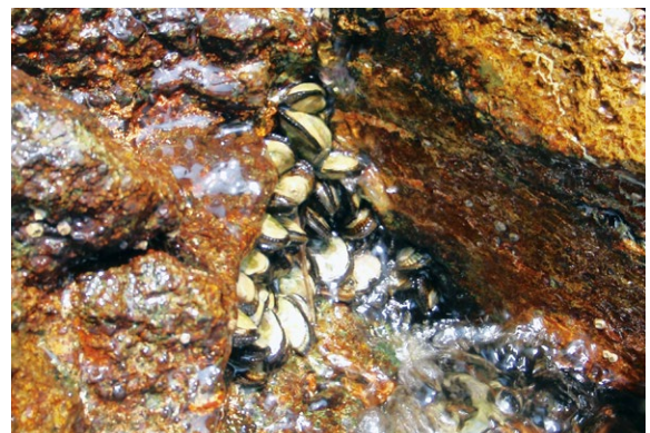
図1 カリガネエガイ

次に、新しくリストに入れられた種として、シモダギボシムシやスゲガサチヨウチン、カリガネエガイ、アカテガニ、クロベンケイガニ、スナガニがあります。その経緯について簡単に解説いたします。