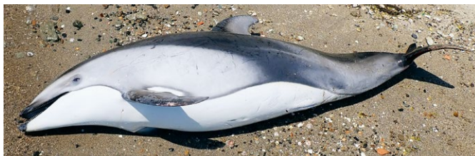
能登町小浦海岸に漂着したカマイルカ