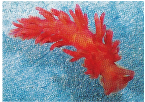
図4 ツクミノウミウシ

シモダギボシムシ 長さ10cm以内で黄色っぽい体をもつ、ぱっと見て「みみず」のような体の動物です。この仲間は橋の欄干 らんかん や寺社の柱 じしゃ の上部に設置される、擬宝珠 ぎぼうし のような頭部をもつので「ギボシムシ」と呼ばれています。海底が砂や泥のたまった場所に生息していて、いまのところ日本海では九十九湾でしか見つかっていません。このため地域個体群に選定されました。