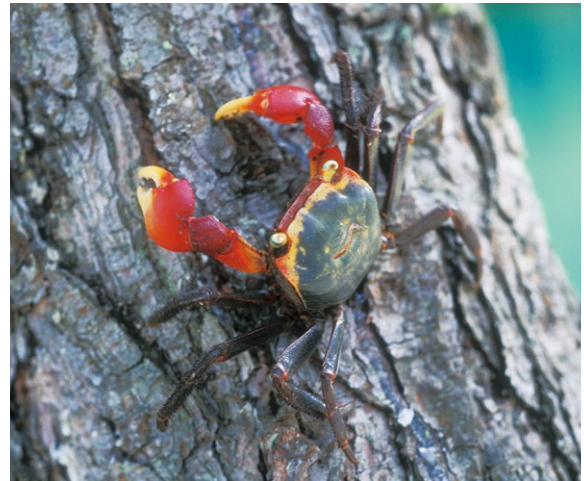
図5 アカテガニ

ツクミノウミウシ 全身が赤紫色で最大8mm程度の小さなミノウミウシの仲間です。九十九湾周辺で見つかったので、この様な名前を付けられたことから、地域個体群に選定されました。めったに見つからないので生態不明です。