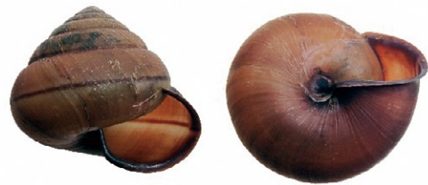
能登町越坂の九十九湾園地で見つかったコシダカコベソマイマイ (NMCI MO-1803)