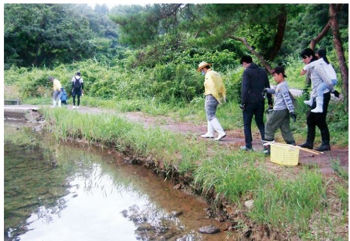
『海辺のウォークガイド』の実施風景（九十九湾探勝歩道にて）

ふたをあけてみると好評で、参加者の多くが「磯の海中観察」を申し込まれました。ただし、風波が強い時は「水辺のウォッチング」にふりかえていただくことにしました。7月23日から8月31日の期間中に、大人102名、小人103名の計205名にウォークガイドを体験していただくことができました。「ガイドを独り占めで気兼ねなく質問等できて良かった。」とか、「来年度も実施してほしい」という意見をいただきました。このような形で実施するイベントの需要があることを実感しています。（普及課長補佐）