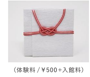
(体験料 / ¥500+入館料)