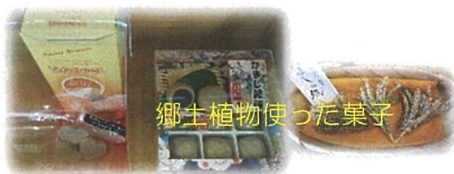
郷土植物を使った菓子

当企画展では、奥能登地方や白山麓などの特用林産物を使った特産品とその加工の工程、さらには新たな商品の開発を巡る地域活性化の取り組みなどについて広く紹介します。