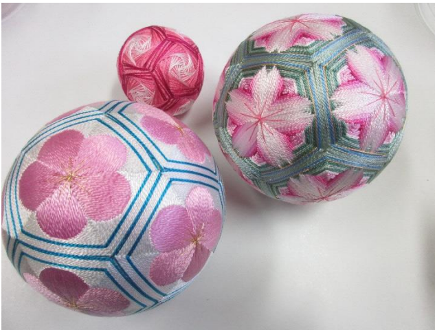
加賀てまり毬屋「梅」「菊桜」「うずまき」