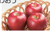
石川オリジナル「秋星」