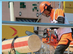
伐木チャンピオンシップ