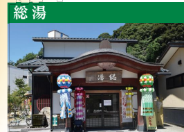
立ち寄り湯として、多くの人に利用されています。