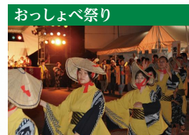
毎年8月の終わりに粟津温泉の開湯を祝い、恋物語を唄った「おっしょべ節」を踊ります。