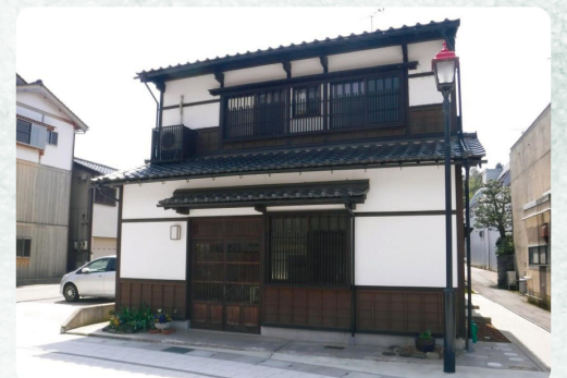
まちづくり協定に基づき、修景された建物