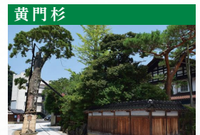
加賀三代藩主・前田利常公のお手植えと伝えられ、粟津温泉の守り神として大切にされています。