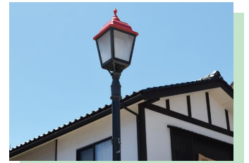
そぞろ歩きの場を演出する情緒ある和風の照明