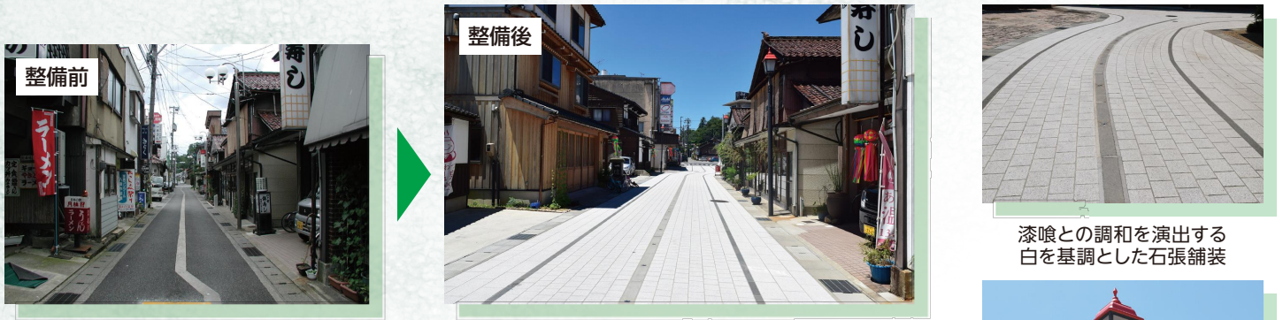
漆喰との調和を演出する白を基調とした石張舗装