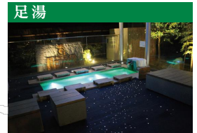
新たな交流の場として、親しまれています。