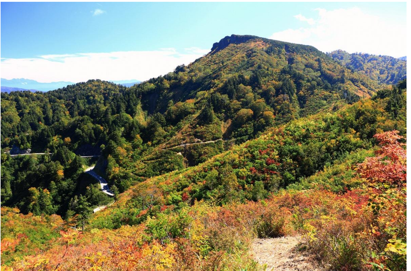
トレッキングルートから三方岩岳（正面）、北アルプス（左奥）を望む〔岐阜県側〕