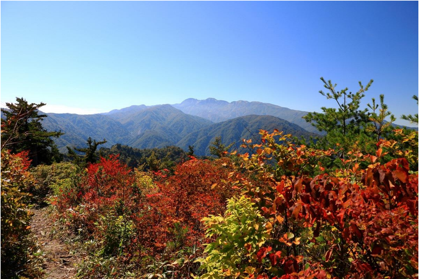
トレッキングルートから白山を望む〔石川県側〕