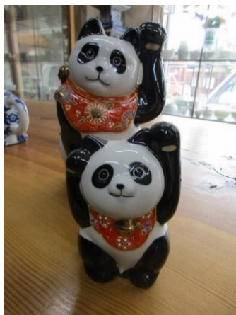
(有)マルヨネ 陶芸窯 和陶房（九谷焼）パンダ