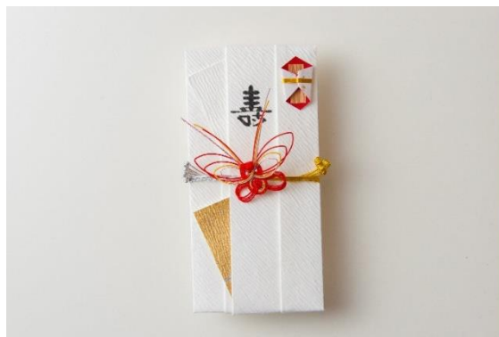
津田水引折型（加賀水引）チョウチョ