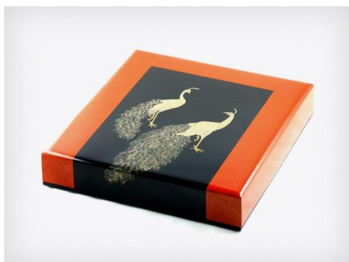
漆・夢工房 清里（輪島塗）クジャク