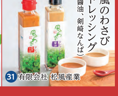
31 有限会社 松風産業