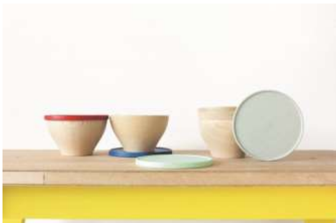
畑漆器店（山中漆器）