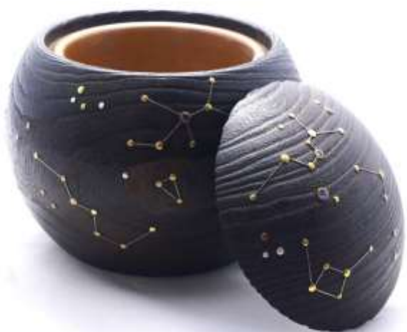
岩本清商店（桐工芸）