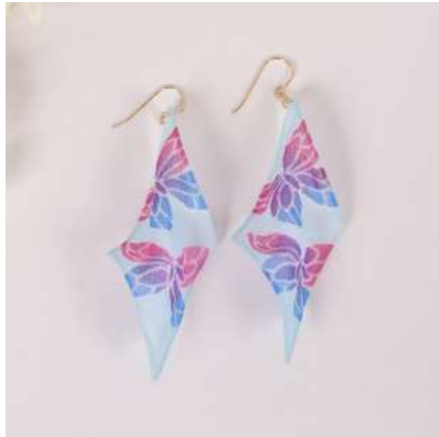
手描き加賀友禅ピアス制作体験