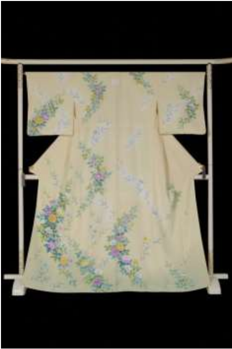
毎田染画工芸 毎田仁嗣 (加賀友禅)