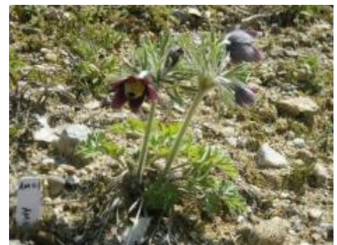
開花したオキナグサ (白山ろくテーマパーク)