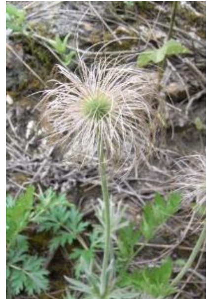
5月～6月、種子になった様子

問合せ 石川県白山自然保護センター 〒920-2326 石川県白山市木滑又4 TEL. 076-255-5321 (月～金曜日の8:30～17:00にお願いします) FAX. 076-255-5323 E-mail hakusan@pref.ishikawa.lg.jp ※写真ファイル提供可。必要な社はお尋ねください。