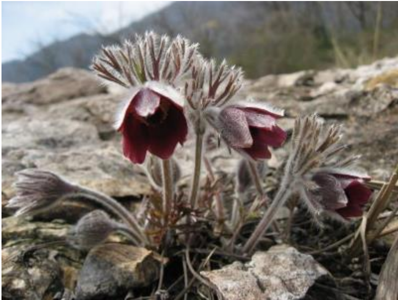
4月～5月中旬、花が咲く

指定された種については、捕獲や採取、所持、譲り渡し、譲り受けを禁止し、無許可で採取した場合は1年以下の懲役、もしくは50万円以下の罰金に処せられる。