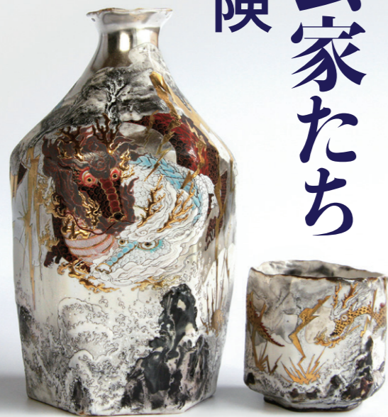
上：中田博士《真珠光彩 壺》2017年 個人蔵 下：牟田陽日《夫婦龍雷海図 徳利・くい呑》2016年 個人蔵