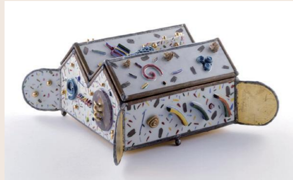
川口淳 《Box-Pandora》1994年

東京国立近代美術館工芸館が2020年に石川県金沢市に移転します。それに先立ち、小松市に工芸の名品がやってきます。日本の工芸史を彩る精鋭たちの作品を、小松市立本陣記念美術館の館蔵品を含めて約40点、5つのテーマに分けてご紹介します。楽しく、ユーモラスで不思議な作品をとおして、みなさんを「か・た・ちをめぐり冒険」へと誘います。