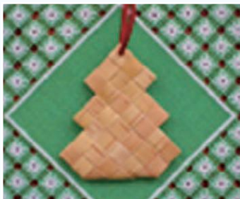
クリスマスの飾りにもぴったりです。 紐の色は当日お選び頂きます。