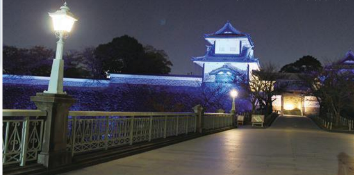
平成28年度・金沢城公園石川門