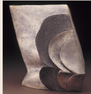
熊倉順吉 《夏の雲》1985年