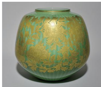
吉田美統 《釉裏金彩牡丹唐草文壺》 1993年頃 小松市蔵

1906(明治39)年に吉田庄作が興した錦山窯。初代・二代共に金の扱いに優れ、その時々金を使った独自の技法を生み出してきました。三代美統は、「釉裏金彩」の技法で2001(平成13)年に国の重要無形文化財保持者(人間国宝)に認定されました。錦山窯の歴史も絡めながら、吉田美統のこれまでの仕事をふりかえります。