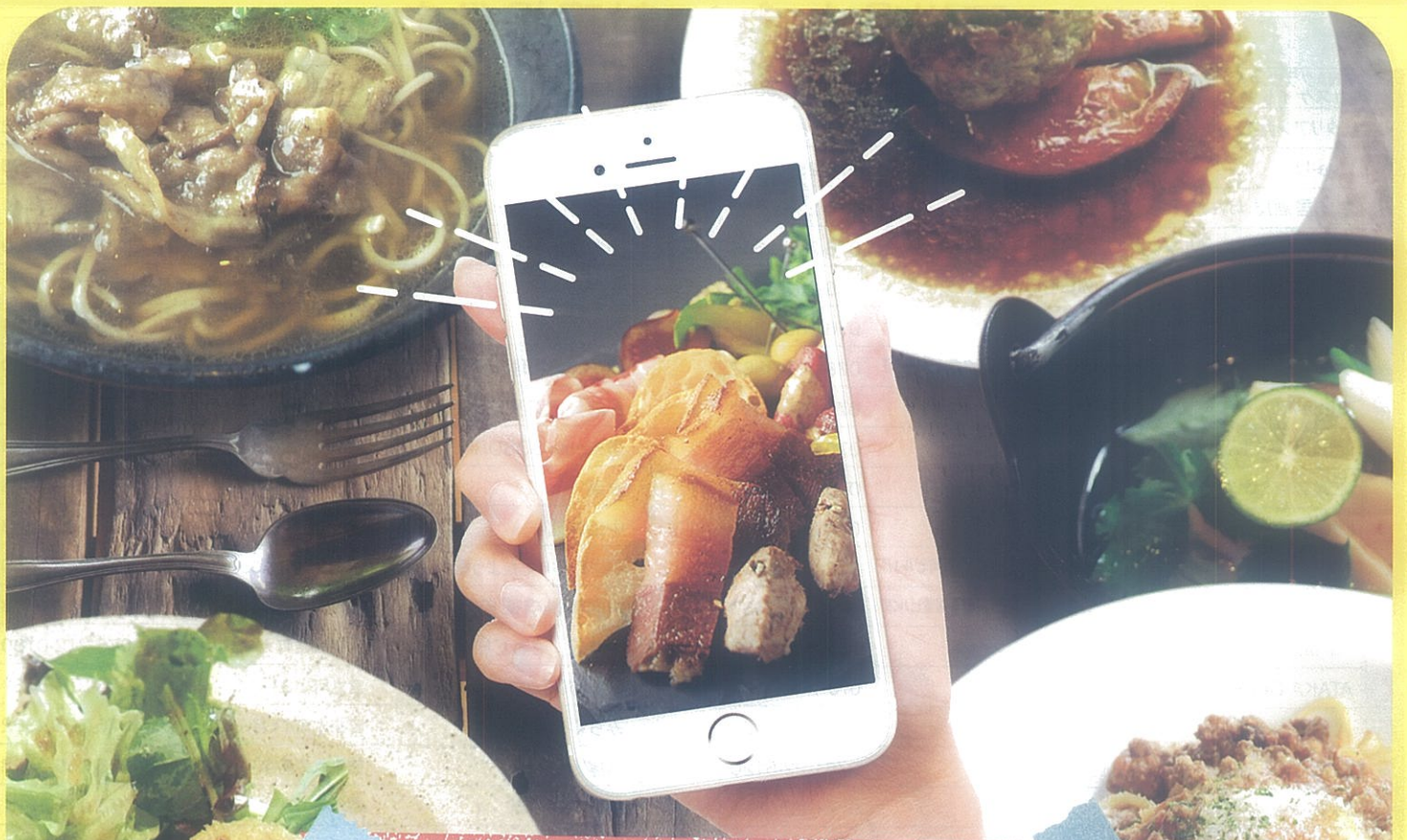
掲載写真はイメージです。