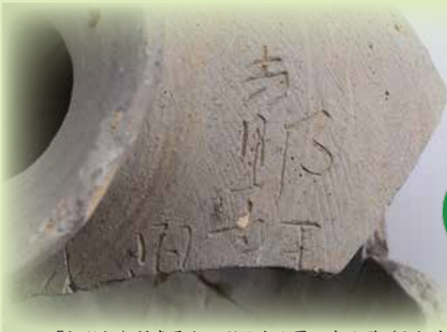
「与野評」刻書平瓶・那谷金比羅山窯跡群(小松市)

よのこおり 「与野評」って何？ この窯跡群の資料が まとまって公開されるのは 初めてなんだって！