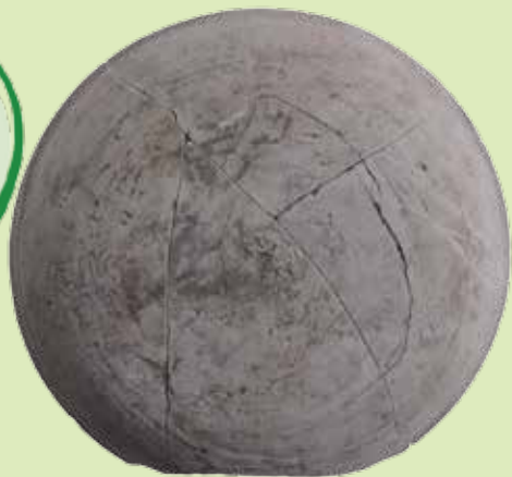
「市殿」墨書須恵器坏 古府ヒノバンデニバン遺跡(七尾市)

奈良時代に能登国 が設置した国府市の関 連施設があったのでは？ 役人が一生懸命文字を 練習した“習書木簡” も出土！