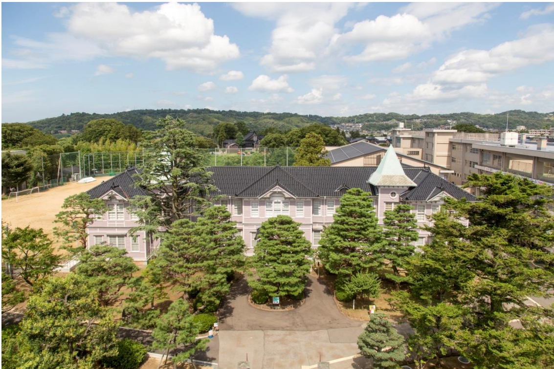
旧石川県第二中学校本館全景（南西から）