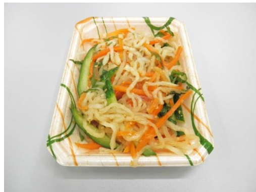
④切干大根の香り和え