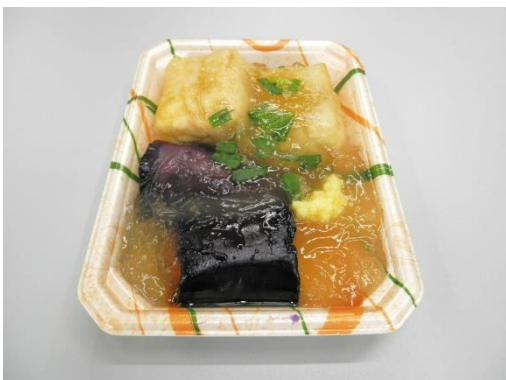
⑤茄子と豆腐の揚げ出し