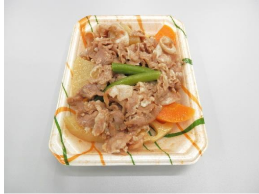
②豚肉と根菜の黒酢煮