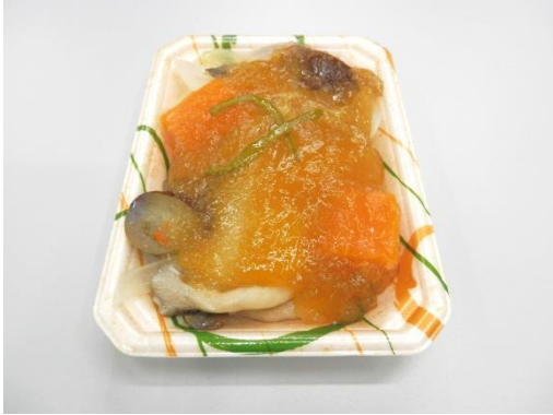
①豆腐と野菜の甘酢あんかけ