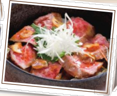
西能登おもてなし丼