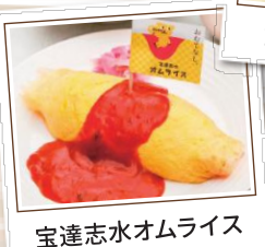
宝達志水オムライス