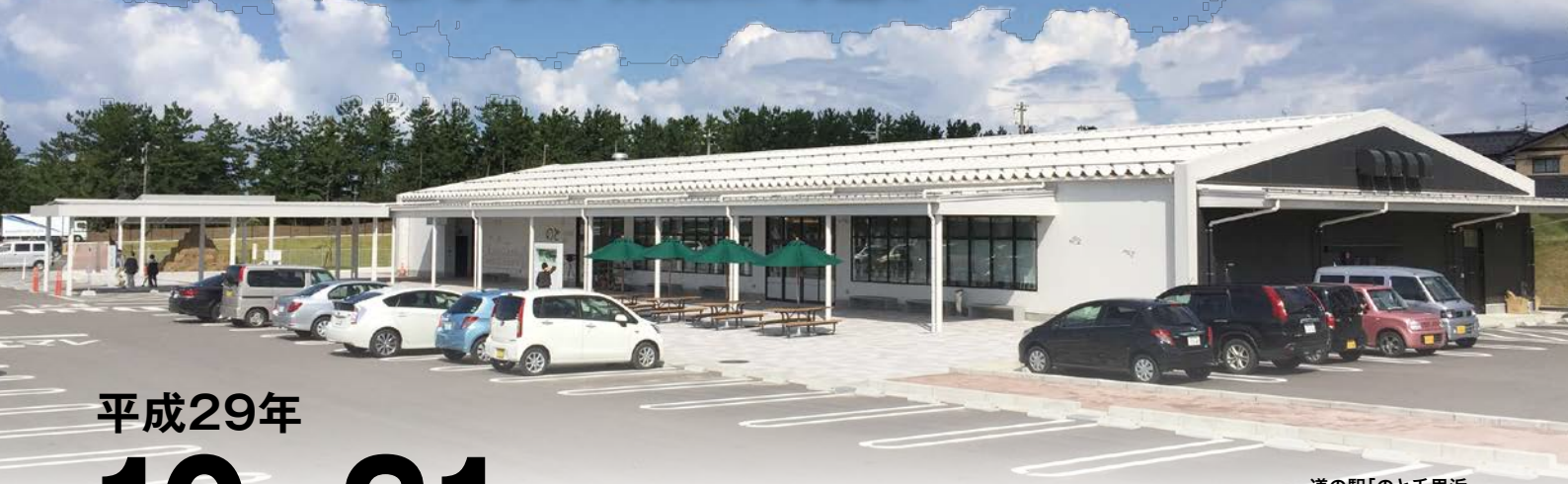
道の駅「のと千里浜」