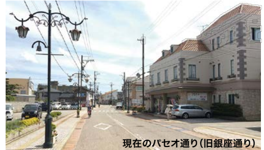
現在のパセオ通り(旧銀座通り)