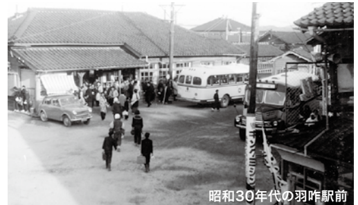
昭和30年代の羽咋駅前