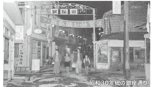
昭和30年代の銀座通り