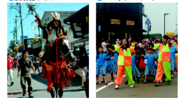
●ハロウィンパレード