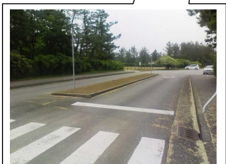
駐車場前分離帯 花壇