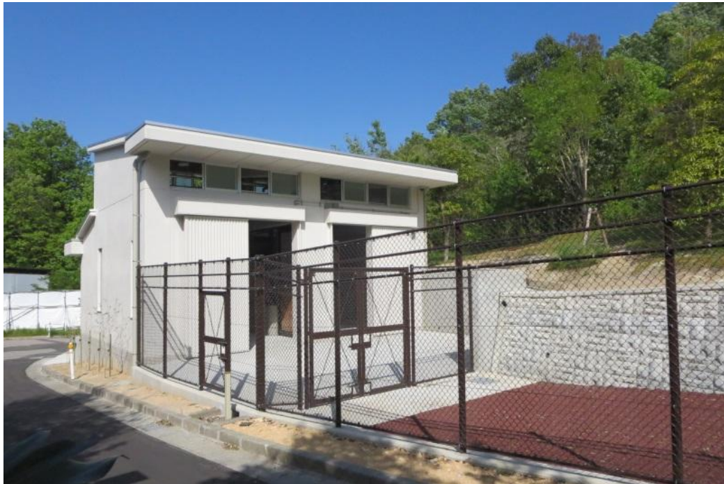
増築したキリン舎（2室ある）