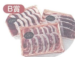
賞品写真はイメージです