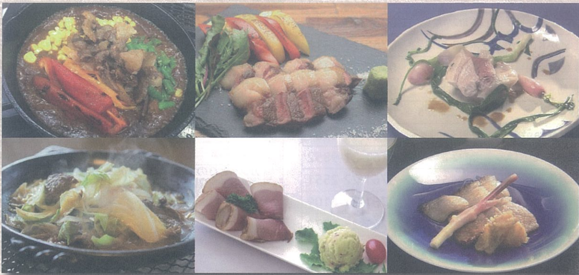
掲載写真はイメージです

いしかわジビエ料理フェアは、こまつ地美絵、白山麓猪、のとしし協賛店などと連携して、ジビエ料理を上記の期間、みなさんに提供します。