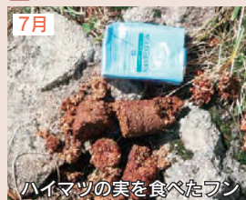
ハイマツの実を食べたフン