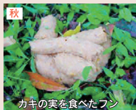
カキの実を食べたフン