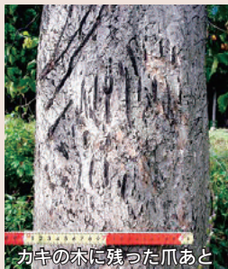
カキの木に残った爪あと