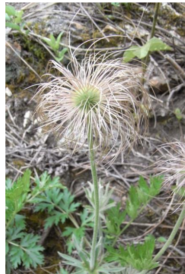
5月～6月、種子になった様子

問合せ 石川県白山自然保護センター 〒920-2326 石川県白山市木滑又4 TEL. 076-255-5321 (月～金曜日の8:30～17:00にお願いします) FAX. 076-255-5323 E-mail hakusan@pref.ishikawa.lg.jp ※写真ファイル提供可。必要な社はお尋ねください。