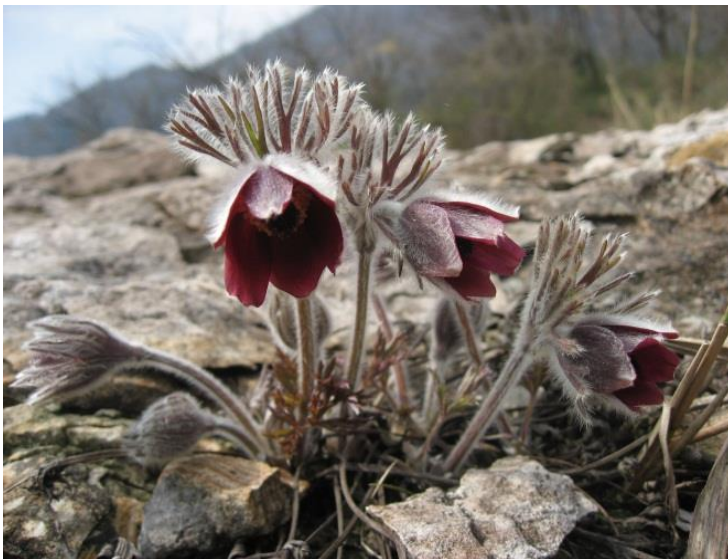
4月～5月中旬、花が咲く

指定された種については、捕獲や採取、所持、譲り渡し、譲り受けを禁止し、無許可で採取した場合は1年以下の懲役、もしくは50万円以下の罰金に処せられる。