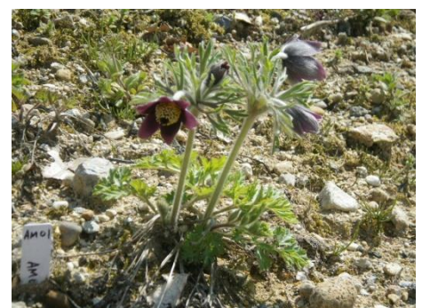
白山ろくテーマパークに 植栽、開花したオキナグサ