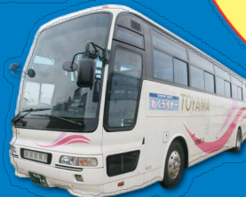
加越能バス わくライナー