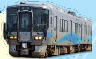
あいの風とやま鉄道