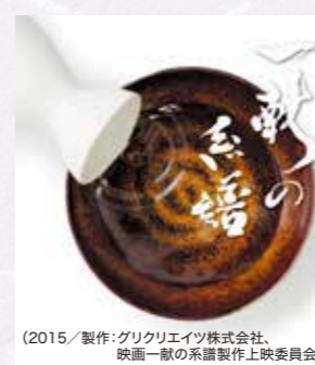
(2015/製作: グリコクリエイティブ株式会社、映画「一献の系譜」上映委員会)

『一献の系譜』作品概要 能登半島を拠点に、全国の酒蔵に向いて日本酒を醸してきた「能登杜氏」にスポットを当てたドキュメンタリー映画。