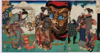
歌川国芳《五節句の内 睦月》

1.4(水)~2.12(日) 四季を愛で、旅に魅せられ、相撲と歌舞伎に熱狂した江戸の人々の暮らしを、浮世絵版画を通して紹介します。 料金:一般600円、大学生400円、高校生以下無料