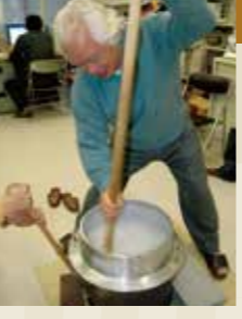
協力:(一財)石川県文化財保存修復協会