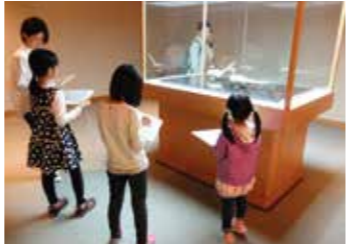
※展示室の観覧料が必要

2.5(日) 受付:13:00~15:00 (所要時間30~40分) 展示室でお気に入りの作品を磁気式ボードにスケッチしてみよう! 作品はポストカードにプリントアウトして持ち帰り可能です。