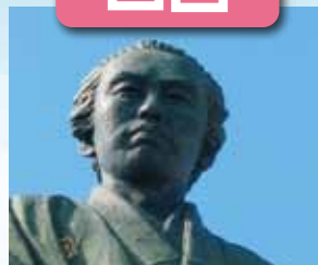
坂本龍馬像 / 最寄: 高知龍馬空港