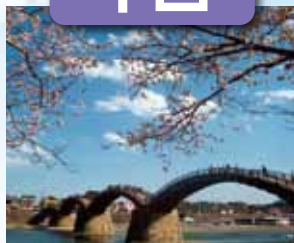
錦帯橋 / 最寄: 岩国錦帯橋空港