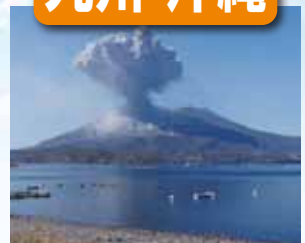
桜島 / 最寄: 鹿児島空港