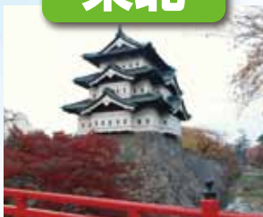
弘前城 / 最寄: 青森空港