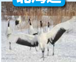
釧路湿原 / 最寄: たんちょう釧路空港