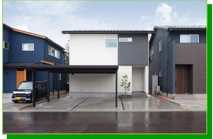
平成27年度 新築部門 優秀賞