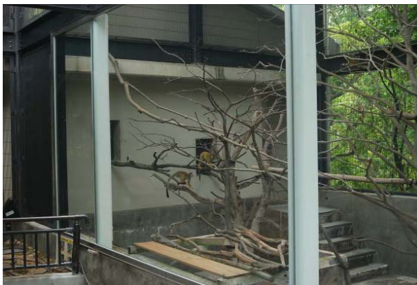
リスザルの展示場