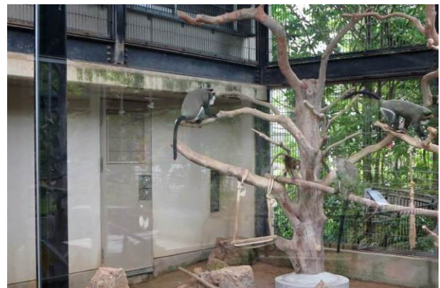
ブラッザモンキーの展示場