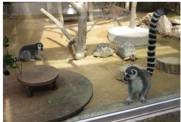
ワオキツネザルの展示場