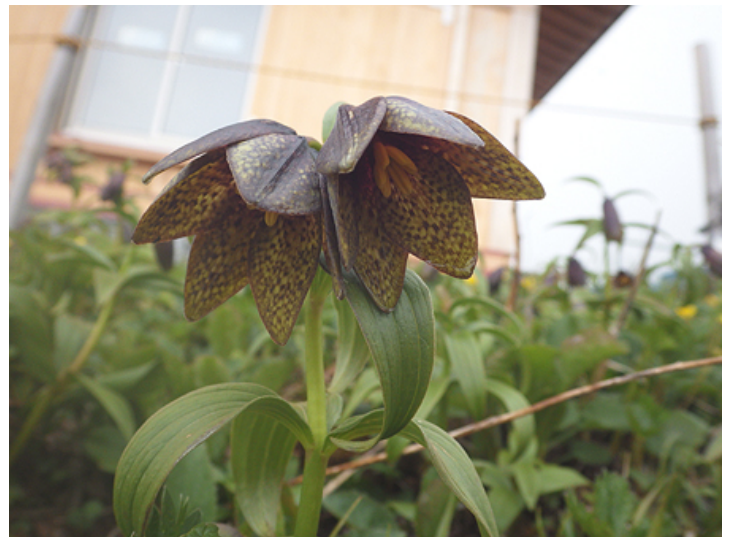
写真2 クロユリ (花) (H28. 6. 20 室堂(白山比咩神社祈禱殿裏) 調査地)