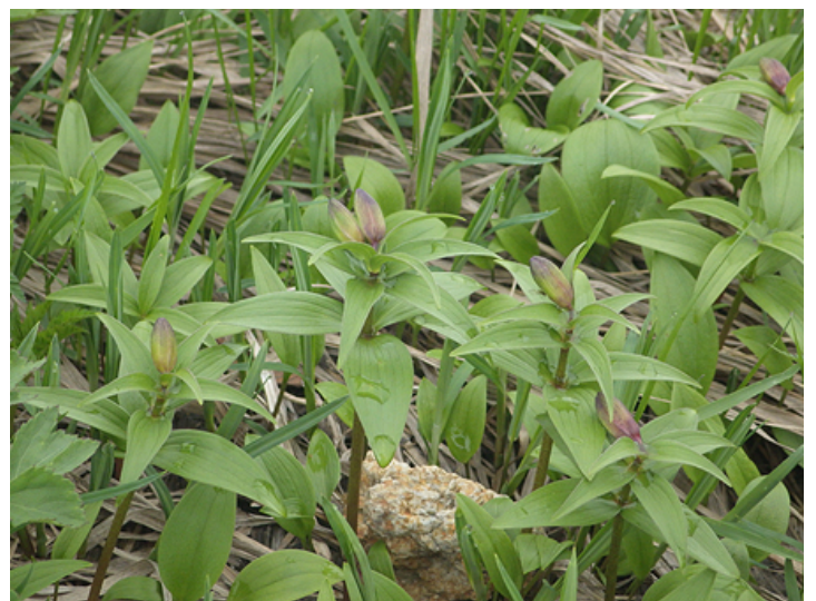
写真4 クロユリ (つぼみ) (H28. 6. 21 エコーライン下 調査地)