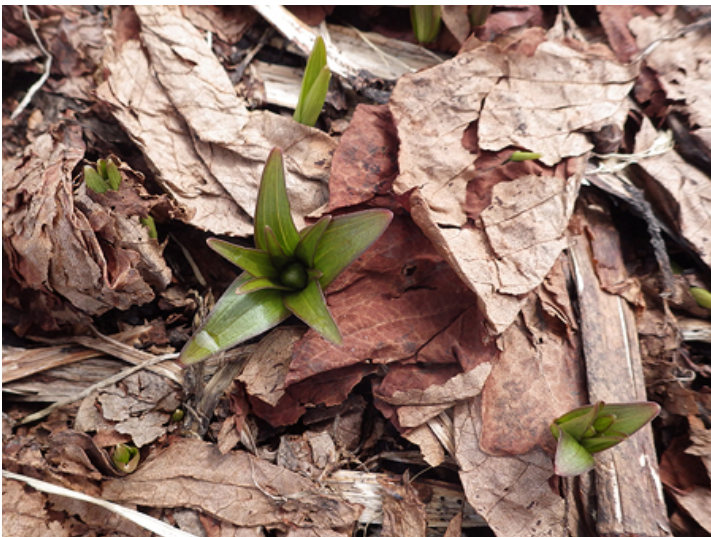
写真1 クロユリ (芽) (H28. 6. 21 水屋尻1 調査地)