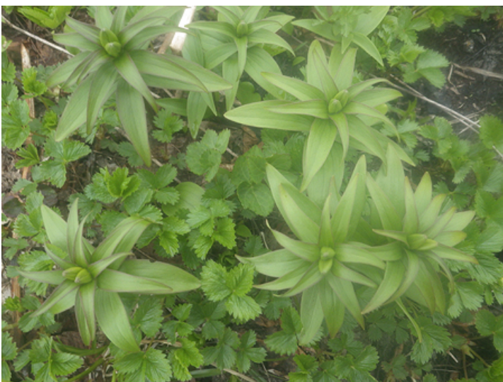
写真3 クロユリ (芽) (H28. 6. 20 弥陀ヶ原2 調査地)