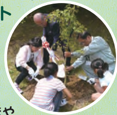
オープニング イベント