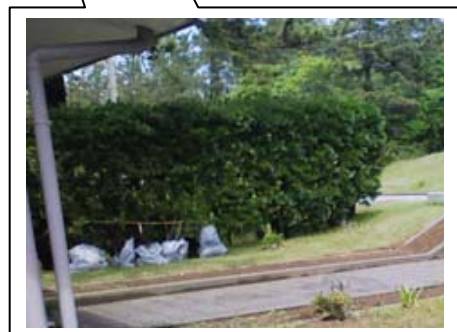
管理事務所前 花壇