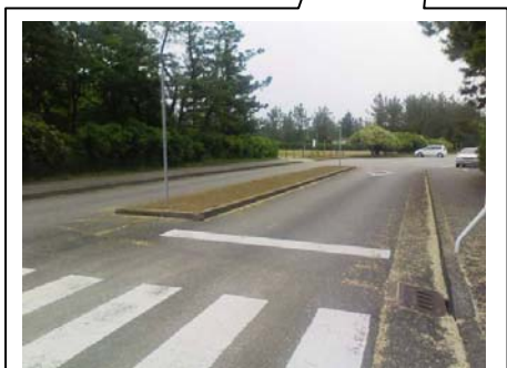
駐車場前分離帯 花壇