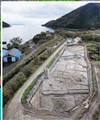
「塩津港遺跡」