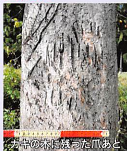
カキの木に残った爪あと