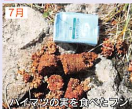
ハイマツの実を食べたフン