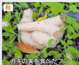
カキの実を食べたフン