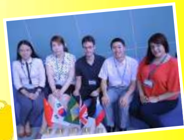
5か国の国際交流員も 皆様をおもてなし！