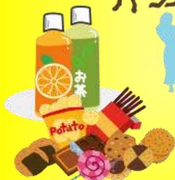
軽食と飲み物も ご用意！