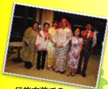
民族衣装での ご参加も大歓迎！