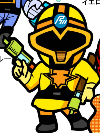
ワクチン イエロー