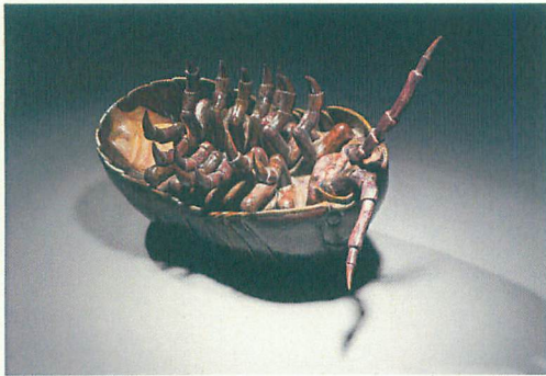
「ふき溜まり」 26cm x 46cm x H 36cm