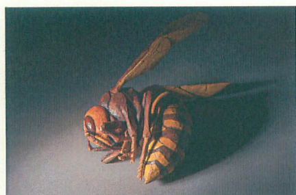
「あの空」 25cm x 25cm x H 22cm

2010年～ 東京都立多摩小児総合医療センター彫刻制作(日建スペースデザイン企画)