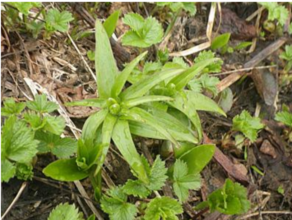
写真3 クロユリ（芽） （平成26年7月8日 弥陀ヶ原2調査地）