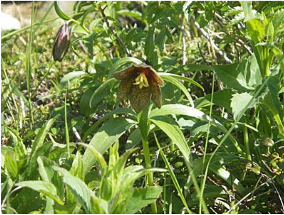
写真1 クロユリ（両性花） （平成26年7月9日 山頂下調査地）