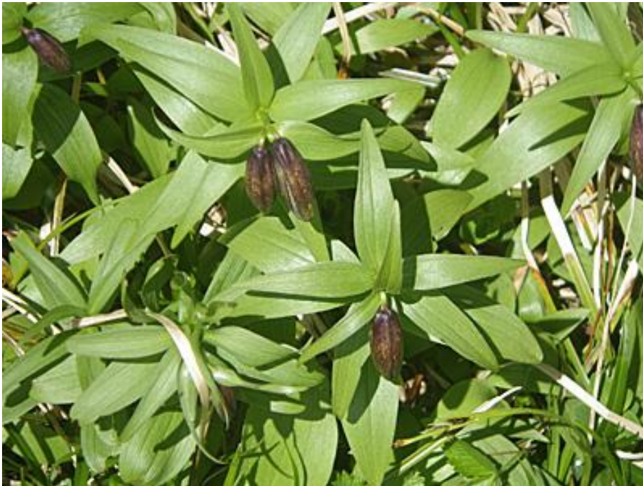
写真2 クロユリのつぼみ （平成26年7月9日 室堂の展望台周辺）